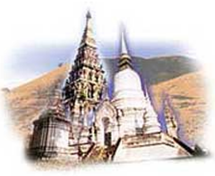
สำนักงานจังหวัดเชียงใหม่ โทร. (053) 221457

งานประเพณียี่เป็ง จัดขึ้นในช่วงวันลอยกระทงของทุกปี เป็นงานประเพณีที่น่าสนใจของจังหวัดเชียงใหม่ จะมีการปล่อยโคมลอยเพื่อเป็นการบูชาพระธาตุจุฬามณีบนสวรรค์ มีการจุดดอกไม้ไฟ ประประกวดกระทง ขบวนแห่นางนพมาศ ฯลฯ